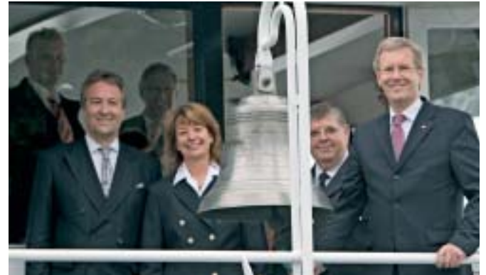
Der Bundespräsident auf Schiffstour

Bei seinem ersten Antrittsbesuch in der Bundesstadt nannte Bundespräsident Christian Wulff die „Bonner Demokratie“ die „erfolgreichste Phase in der deutschen Geschichte“. Er habe keine Hauptstadt der Welt kennen gelernt, in der Nähe, Dichte, Überschaubarkeit und Normalität einen solchen Reiz auf die Menschen ausgeübt hätten wie Bonn. Wulff hob den „meisterhaft gestalteten Strukturwandel“ Bonns hervor. Die Stadt sei vielfältiger geworden. Er nannte die nationalen