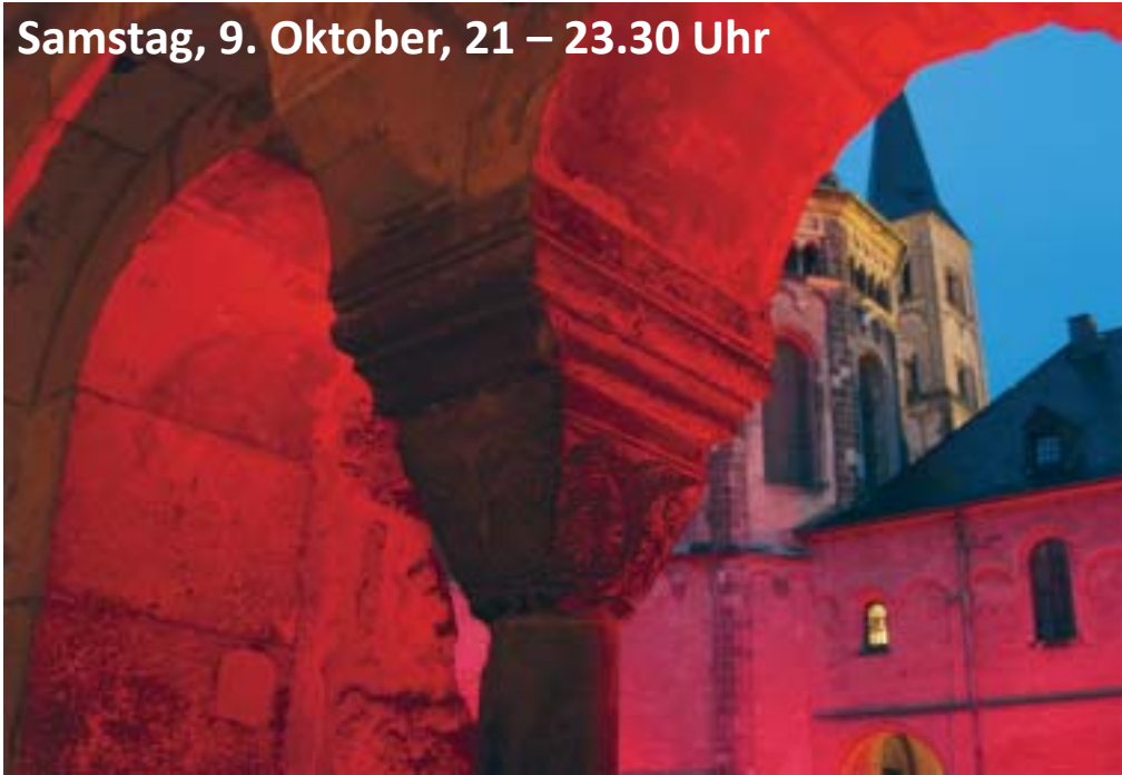
Aktiv werden im Bonner Münster bei angenehmem Farbenspiel und besinnlicher Musik

„Und was glaubst Du?“ - Diese Frage ist das Leitwort des diesjährigen Stadtpatronefestes. Sie kommt uns durch die Jahrhunderte der Geschichte christlichen Glaubens entgegen. Die Stadtpatrone Cassius und Florentius werden als Märtyrer verehrt, weil sie ihren Glauben in nichtchristlicher Umgebung bekannt haben und dafür sterben mussten. Wir möchten diese Frage an Sie weitergeben und möglichst viele Menschen ermutigen, uns ihre ganz persönliche Antwort auf diese Frage zu geben.