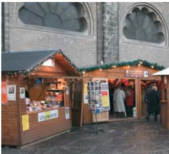
Hoffentlich auch in 2010 wieder auf dem Weihnachtsmarkt

FEST UNSERER STADTPATRONE CASSIUS UND FLORENTIUS 2010