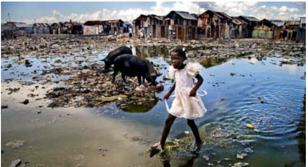
Die Menschen in Haiti benötigen vielfältige Hilfe.