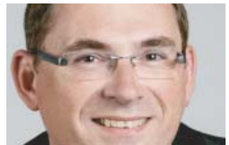
Caritasdirektor Jean-Pierre Schneider

bzw. Ambulanzen. Neben den großen Herausforderungen beim Aufbau der zerstörten Wohnhäuser und der Schaffung einer neuen Infrastruktur kämpfen Entwicklungshelfer auch mit den psychischen und körperlichen Belastungen der