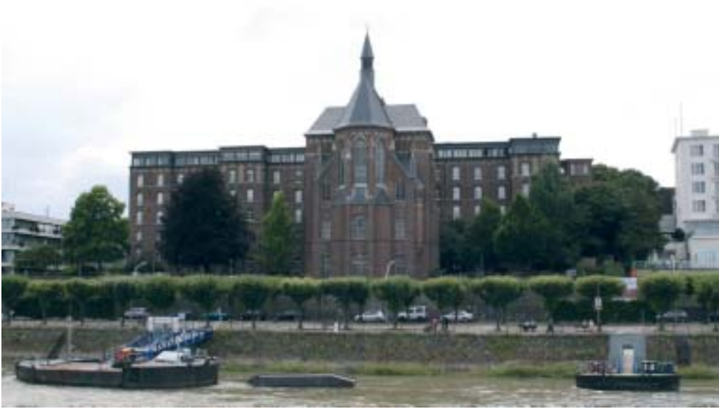
Collegium Albertinum von Beuel aus gesehen.

Von außen sieht der dunkle Backsteinbau mit den neugotischen Fenstern etwas streng aus: eine Feste des Glaubens sollte das Collegium, das Theologenseminar für das Erzbistum Köln auch sein. Vorbild war keine Geringere als die mittelalterliche Marienburg des Deutschen Ordens. Seit 1892 leben Priesteramtskandidaten hier und studieren an der theologischen Fakultät Bonns, bevor sie mit den LaientheologInnen in Köln ihre pastorale Ausbildungsphase beginnen.