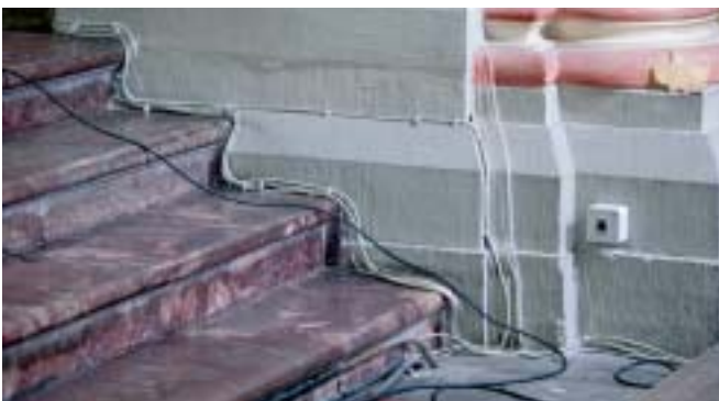
Die Elektrik im Bonner Münster ist hoffnungslos veraltet

Stadtdechant ruft die Bürger zur Hilfe für die Basilika auf