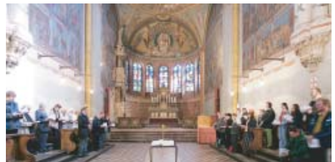
Das Mittagsgebet findet immer um 12.15 Uhr im Hochchor statt

Ob Cassius und Florentius auch um 12.15 Uhr zum Mittagsgebet gegangen sind wissen wir nicht. Sicher ist aber, dass das Mittagsgebet auch in diesem Jahr zu den Stadtpatronen geht. So werden die Teilnehmerinnen und Teilnehmer nach dem Lobpreis eingeladen mit hinunterzusteigen in die Krypta und sich um Schrein und Gruft zu versammeln. Diese Prozession